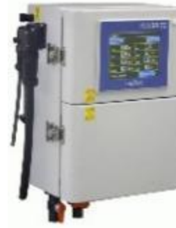
水道水用水質自動測定装置