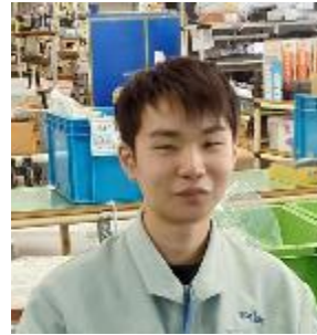
生産部 生産課（2020年入社）

製品の組み立てなどを担当しています。細かい作業でも組みあがっていくと達成感ややりがいを感じます。お客様により良い製品を提供できるように、これからも頑張っていきたいです。近年はバイオマス発電所や工業化が進む漁業などの新分野にも進出。チャレンジ精神旺盛な学生を待ってます。