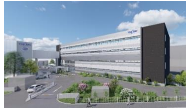
現在、新生産棟を建設中。 2024年7月に完成予定（イメージ図）