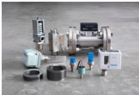
様々な分野で活躍する 自動制御機器