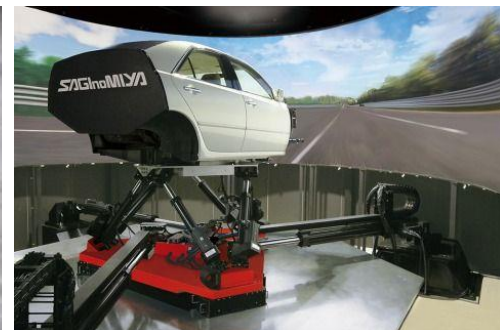
自動車開発に使われる ドライビングシミュレータ