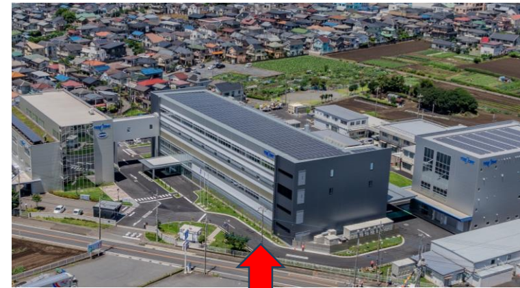
2024年6月に 狭山インテグレーションセンター完成