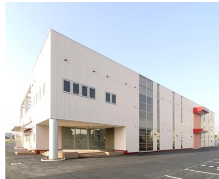
狭山工場（狭山工業団地内）